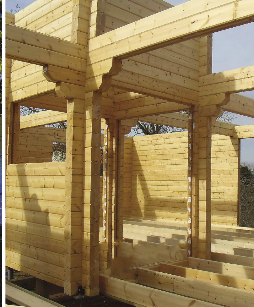
DOM W SZKIELECIE DREWNIANYM (TULUZA, FRANCJA)