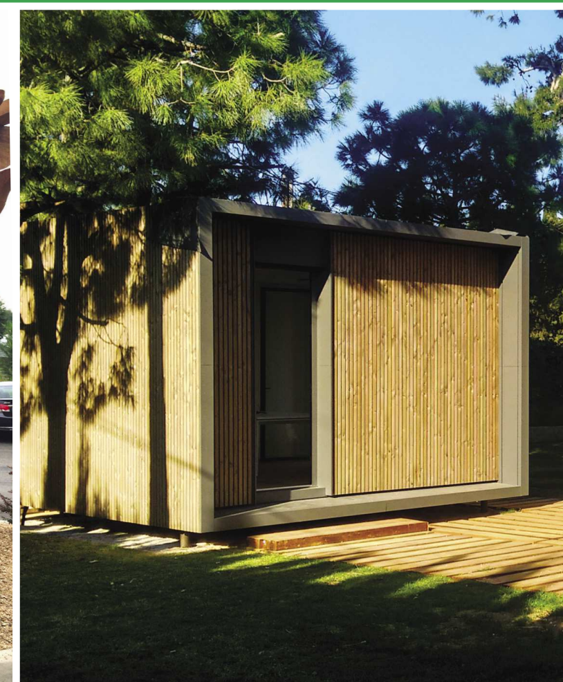
DOMEK MOBILNY (NOEM, HISZPANIA)