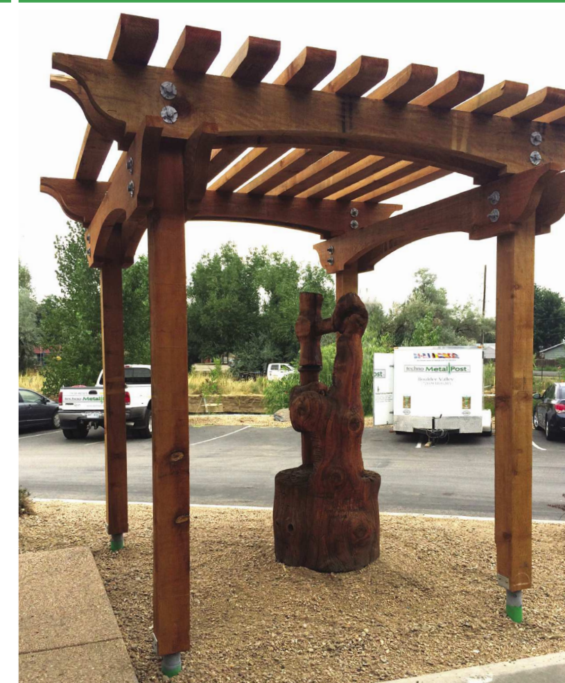
PERGOLA (BOULDER VALEY, USA)