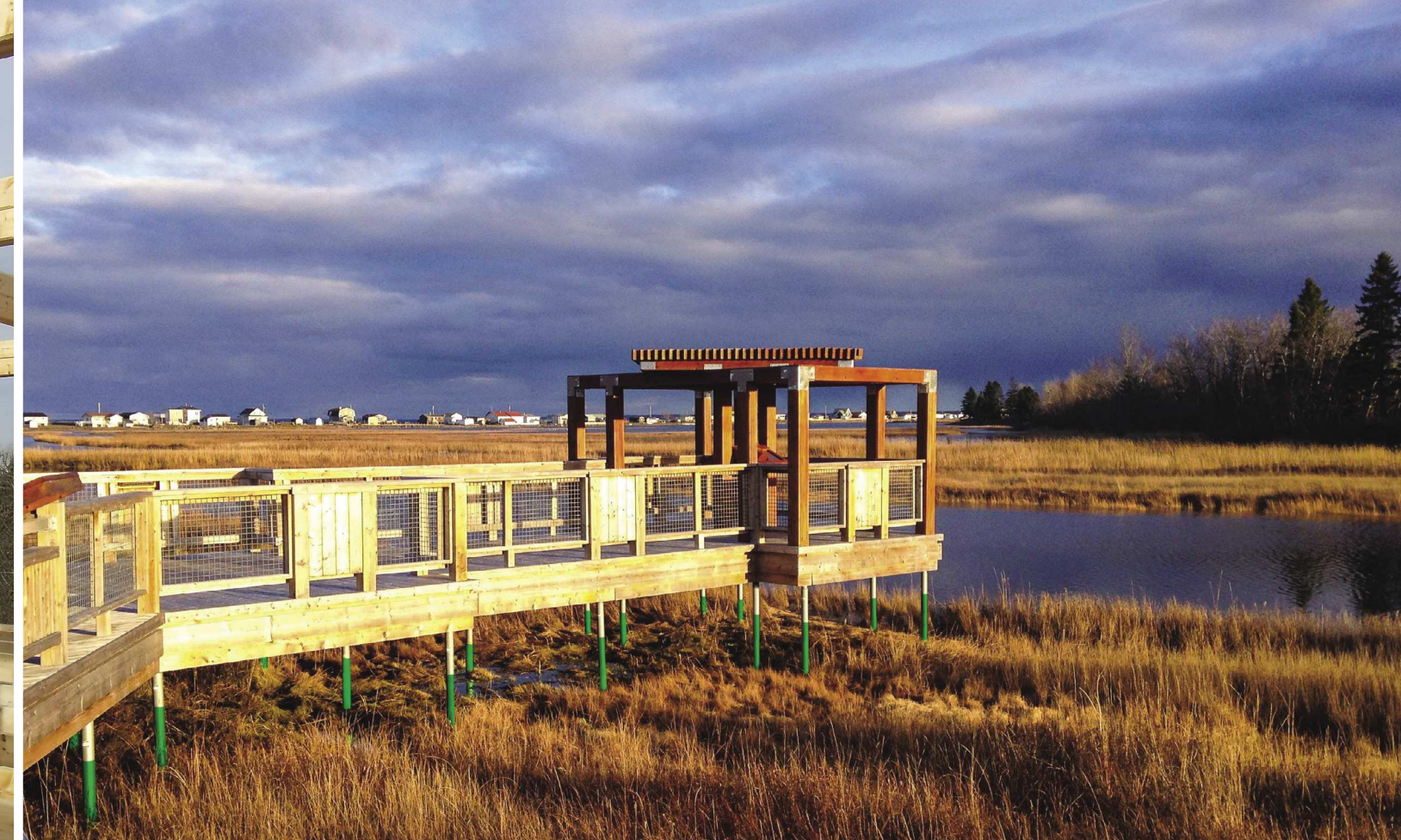
PUNKT WIDOKOWY (NOWY-BRUNSZWIK, KANADA)