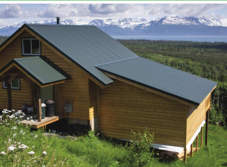
PRZYBUDÓWKA (ALASKA, USA)