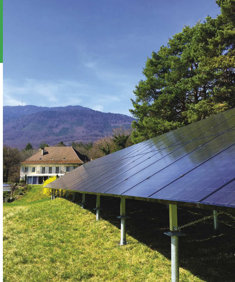
PANELE SOLARNE (FRYBURG, SZWAJCARIA)

» DEDYKOWANY I LEKKI SPRZĘT DO INSTALACJI