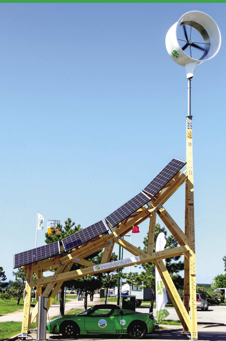
SOLARNA STACJA ŁADOWANIA (MALMO, SZWECJA)