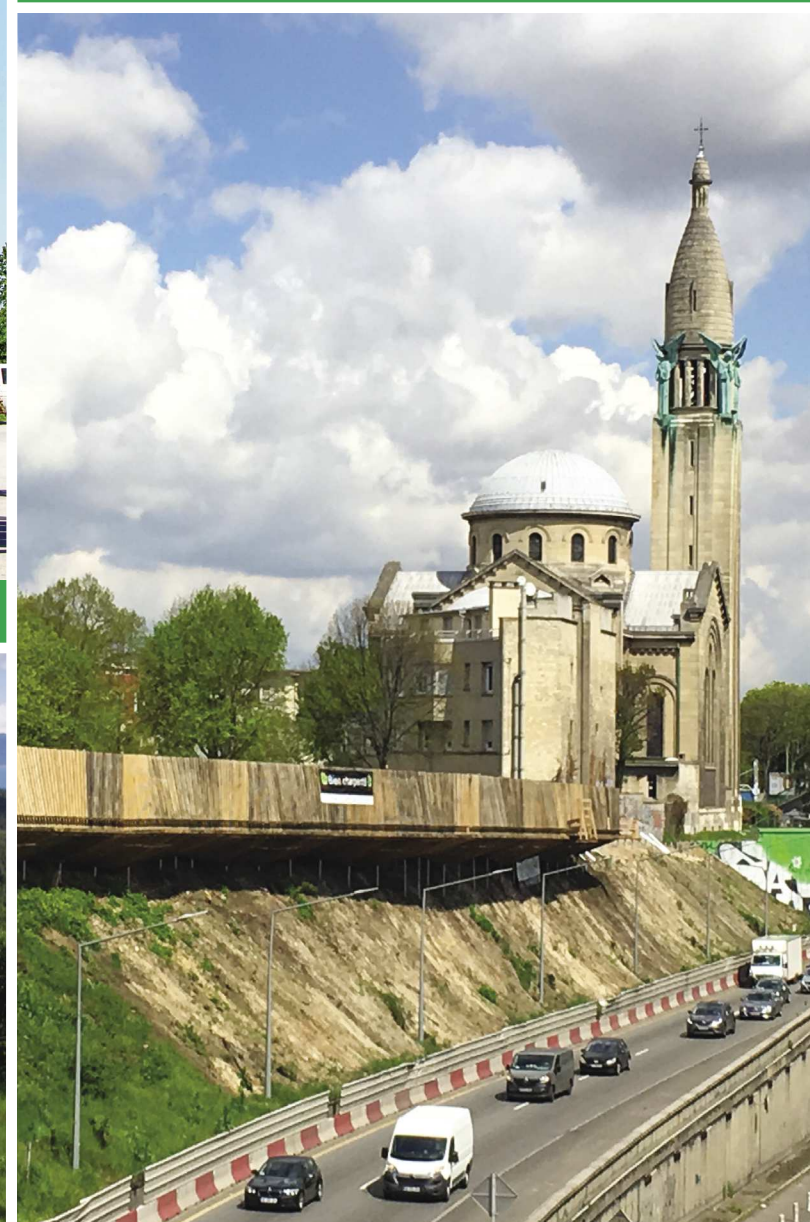
MOST PIESZY (PARYŻ, FRANCJA)