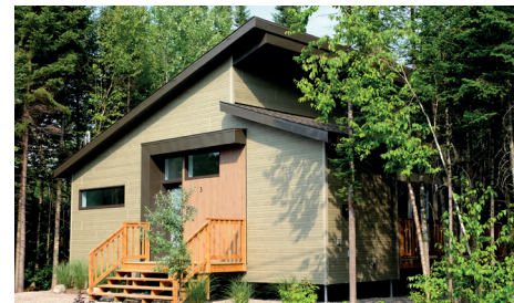
MAISONS / CHALETs