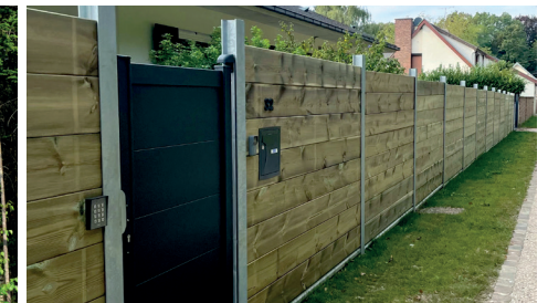
CLÔTURES / AUTRES