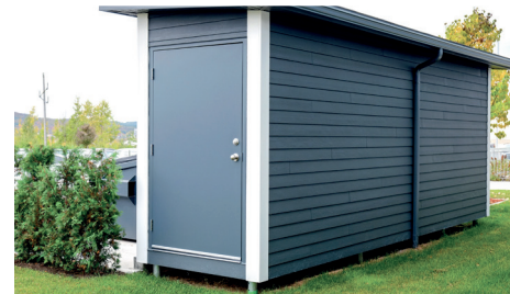
CABANONS / ABRIS